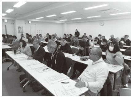
また、NTTドコモ、NDS等グループ会社、名古屋地域での退職及び各地区協議会の役員による加入勧奨により30名の新規会員を獲得しました。

3月末における定年等による退職者予定者は71名であり、NTT労組グループ連絡会と退職者の会の連携により、退職説明会を岐