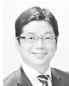
立憲民主党参議院議員 (NTT労組組織内) 石橋みちひろ

NTT労働組合退職者の会 岐阜県支部協会の皆さま、新年明けましておめでとうございます。本年もどうか宜しくお願い申し上げます。昨年同様、新型コロナウイルス感染症という新たな脅威との闘いに終始した1年となり、退職者の会の皆さまの毎日の暮らしにも、大きな影響のあった年であったと思っております。そんな厳しい環境の中で、私の活動に対し、諸先輩方より引き続き温かい応援をいただきましたこと、本当に感謝の言葉しかありません。