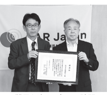
▲難民を助ける会への訪問